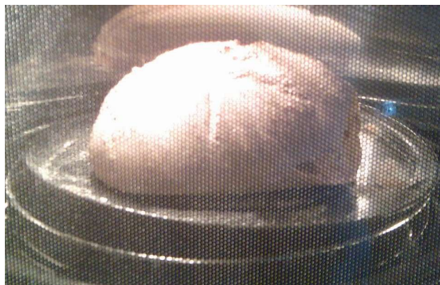
Brot mit normalem Leitungswasser

Die beiden Fotos entstanden jeweils nach 35 Minuten Backzeit.