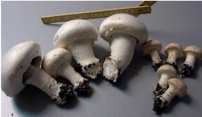
Links energetisierte Pilze - rechts normale Kultur Gewicht: bis 155 g 12 - 17 g

Die Pilze spitzten nach 15 Tagen aus dem Boden (5 Tage früher!). Sie waren auch noch deutlich größer. Während die erste Kultur Champignon-Köpfe mit 4-5 cm hervorbrachte, ist die Größe in der zweiten Kultur bei 7-9 cm.