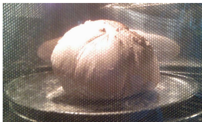
mit energetisiertem Wasser