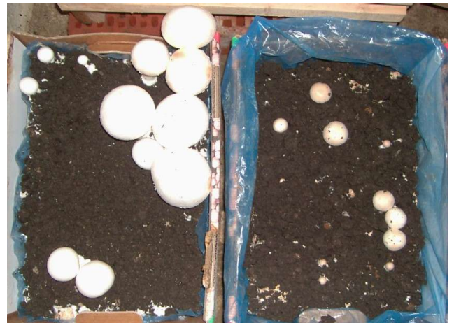
energetisiert nicht energetisiert

- Gemüse / Gartenbau - Ähnliche Phänomene konnte ich mit Radieschen und Salat feststellen. In die Saatreihe der Radieschen wurde zusätzlich ganz dünn energetisierter Quarzsand mit eingestreut. Die Radieschen (Riesenbutter) wurden 4 - 4.6 cm groß und ihrem Namen gerecht. Nämlich riesig, butterzart und nicht holzig.